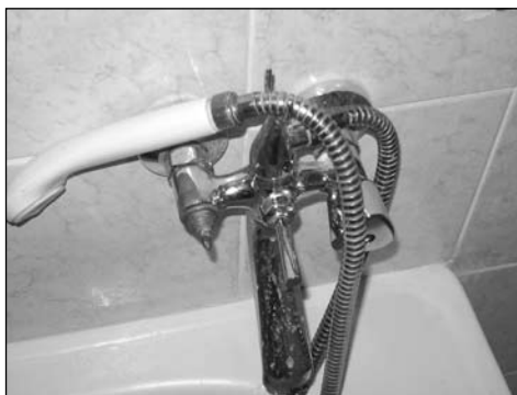
Prílohy: fotodokumentácia poškodeného vybavenia bytu