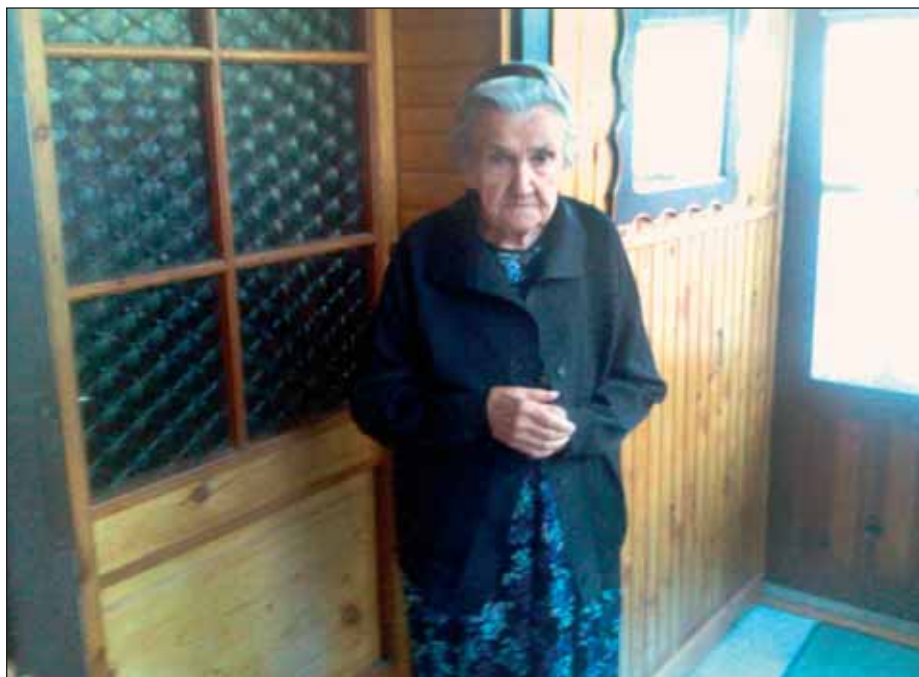
Táto milá, usmievavá a obetavá žienka sa donedávna ešte venovala svojmu celoživotnému koníčku – háčkovaniu.

vali aj chlapi. Keďže sa venovala háčkovaniu už ako dieťa, jej práce majú hodnotu profes-