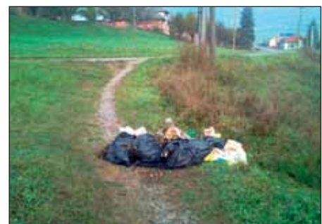
Nájde sa vinník?

Žiť v čistote a poriadku neznamena vyhýbať sa neporiadku a nečistote. Prijmeme si prosím spoločnú filozofiu, filozofiu života v poriadku a čistote. Začnime jednoducho. Každý od seba. Zmeňme svoje postoje a hodnoty k sebe aj svojmu okoliu, zmeňme to „zlé“ v našich hlavách, ktoré nás núti byť ľahostajnými. Neriešme len to, čo je za dverami nášho bytu. Pretvorme to, čo je okolo nás, urobte naše okolie krajším, budme príkladom a po-