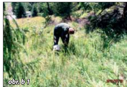
obr. b 1