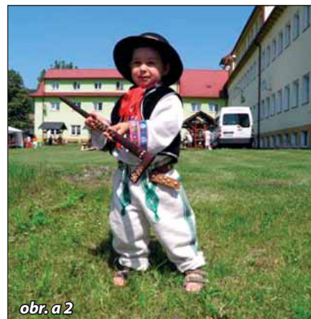
obr. a 2