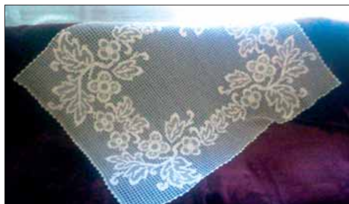
Tento obrus je jej posledným dielom.