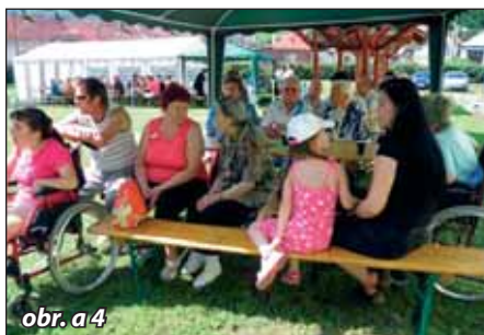
obr. a 4