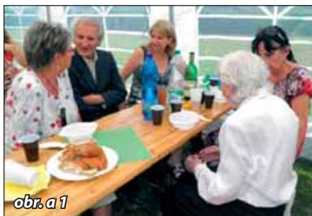
obr. a 1