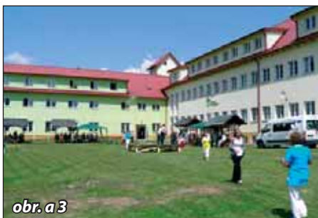
obr. a 3