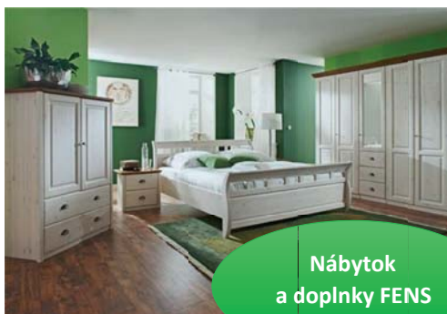
Nábytok a doplnky FENS