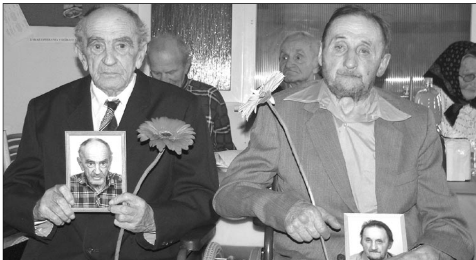
V Nálepkove slávnostne ukončili „Mesiac úcty k starším“