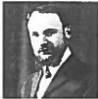
Milan Rastislav Štefánik